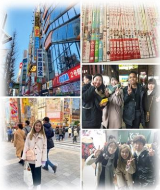
にぎやかな街並みに みんな興味津々!